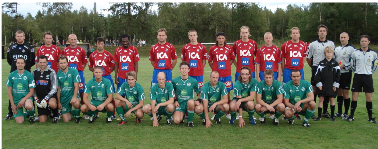
Jubileumsmatchen mot Östers IF den 31/7