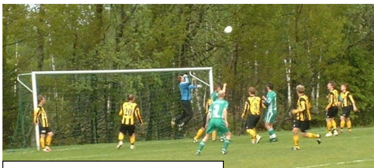
Slätthög vann hemma med 2-1 mot Emmaboda IS

I någon mån blev det nykomlingarnas år. Måhända hamnade Råstorp/Timsfors överraskande högt upp men Råppe gjorde en stabil comeback och Lammhult visade åtminstone på vårsäsongen en för en nykomling typisk vitalitet.