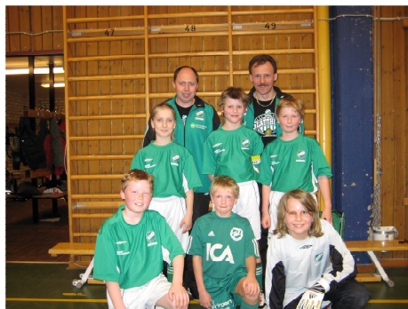
P10-laget med ledare