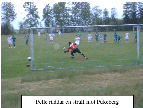
Pelle räddar en straff mot Pukeberg

Desto mer glädjande är det att årets div. IV var riktigt trevlig att följa och det beror inte enbart på att det gick bra för SBoIF. Faktum är att flertalet gästande lag på Hultet spelade